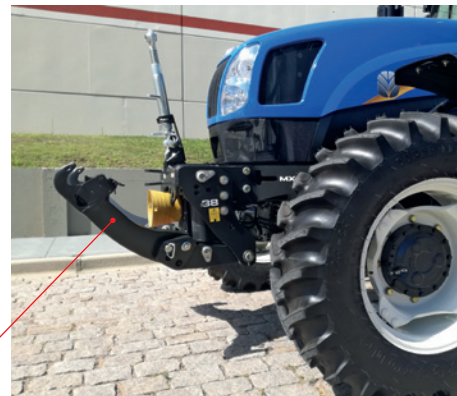
3 posições : 2 fixas e 1 flotante