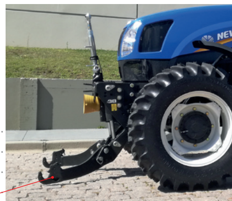
Altura inferior *