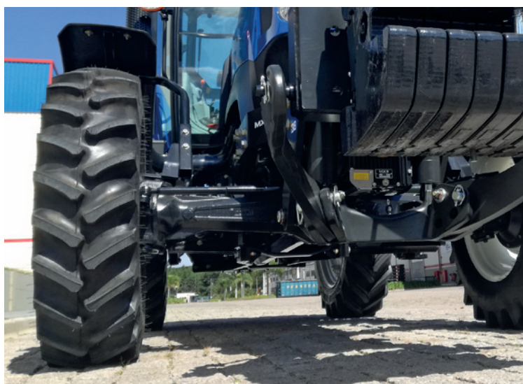
Grande vão livre