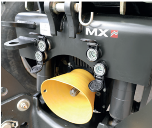
Engate rápido adicional (Opcional)