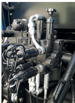
Usando as válvulas do trator (standard)