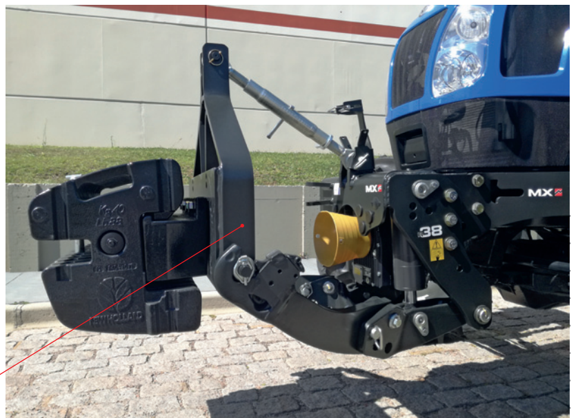
Suporte porta pesos Permite utilizar os pesos originais do trator