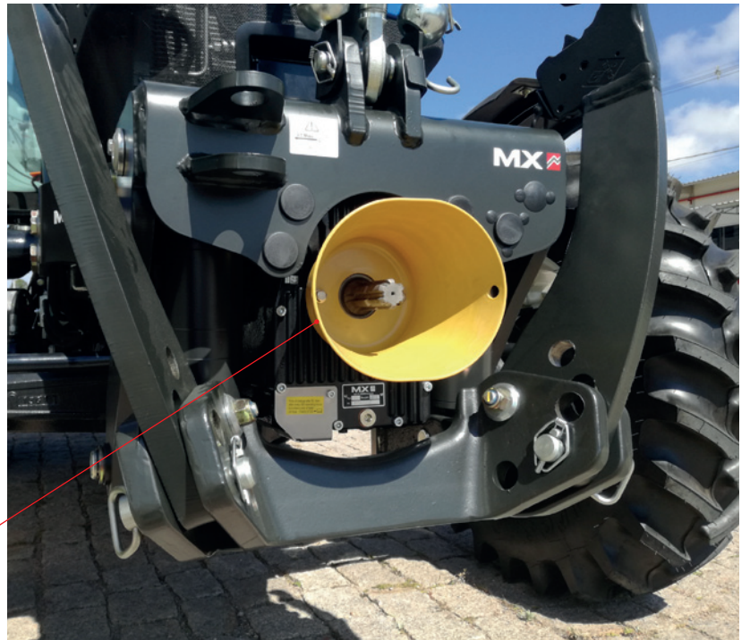
TDF com embreagem integrada, potência máx. 150 hp ou 200 hp (Opcional)